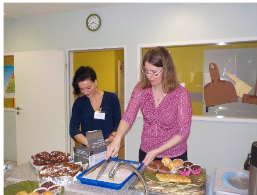
Unsere fleißigen Eltern ©

Ziel: Eltern der Schule kommen mit neuen potentiellen Eltern über ihre Erfahrungen ins Gespräch.